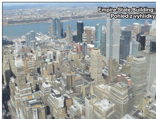
Empire State Building: Pohled z vyhlídky

po schodech by výstup trval asi o dost déle, ten si ostatně můžete vyzkoušet jen jednou v roce, kdy se v Empire State Building stává místem závodu v běhu do schodů. Ale to raději zkušet nebudu, asi bych se zadýchal... S kamarádem jsme si dělali legraci, že ve filmu King Kong na tuto dominantu města lezla velká opice, v rámci naší návštěvy pak opičáci dva menší (já a on).