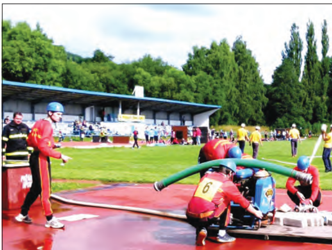
V sobotu proběhlo na hřišti ASK okresní kolo požárního sportu. Zúčastnilo se šest družstev žen a 11 družstev mužů. V obou kategoriích byly nejlepší Velké Opatovice. Další místa soutěže žen obsadily Němčice a Těchov, muži Bořitova a Okrouhlé.