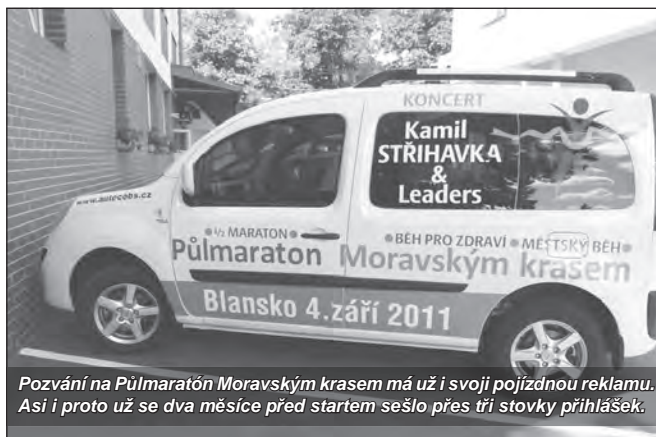
Pozvání na Půlmaraton Moravským krasem má už i svoji pojízdnou reklamu. Asi i proto už se dva měsíce před startem sešlo přes tři stovky přihlášek.