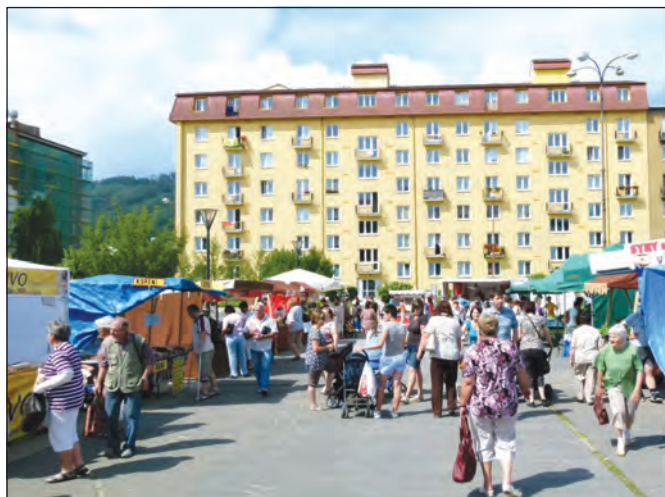
Čtvrteční formanské trhy získaly ve velmi krátké době značnou popularitu a neustále rostoucí zájem blanenských občanů. Trvale největším lákadlem jsou kvalitní uzeniny, čerstvá zelenina a pečivo. Vynikající jsou i slovenské kozí sýry.